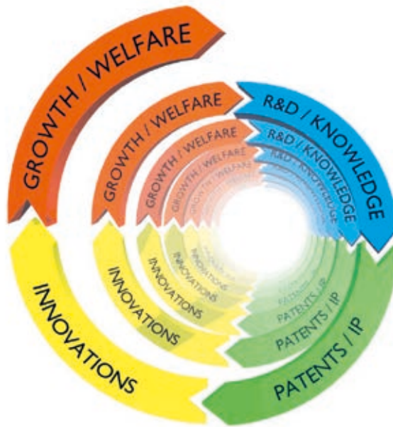
Figur 19.1 Innovationsspiralen